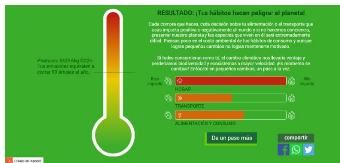
Figura 1. Resultados de Emisiones Gases de efecto invernadero (GEI): Análisis de Hábitos de Consumo.