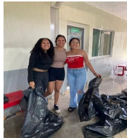
Figura 5. Reciclaje de materiales, por ejemplo, PET (Polietileno Tereftalato) y cartón.