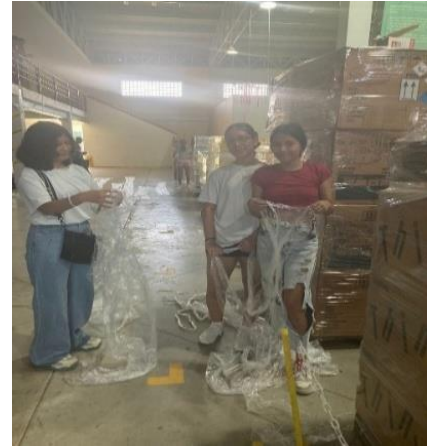
Figura 3. Alumnas de primer cuatrimestre de la carrera de Cadena de suministro, reciclando el material para evento estudiantil.