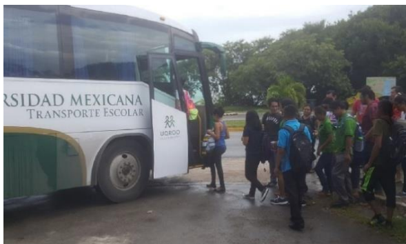
Figura 6. Estudiantes de intercambio.

1,490 km x 2 = 2,980 km = 745 litros de combustible = 1,989.14 kg de CO 2 .