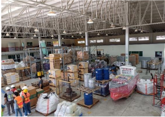
Figura 2. Simulador Logístico de la Universidad Tecnológica de Manzanillo.

En las siguientes imágenes se muestra como la Universidad y la carrera realizan prácticas y festivales.