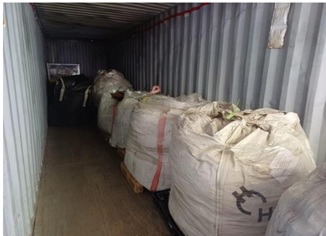
Figura 4. Se cuenta con 17 Maxi bolsas en la Universidad completamente llenas el cual contienen película plástica.